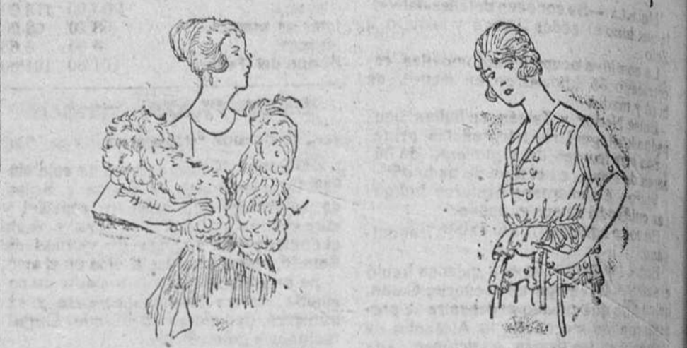
Cuellos de pluma «Saido» desde 25 á 65 pts. Jerseys lana, en colores novedad, á 15, 18, 20 y 25 pts.