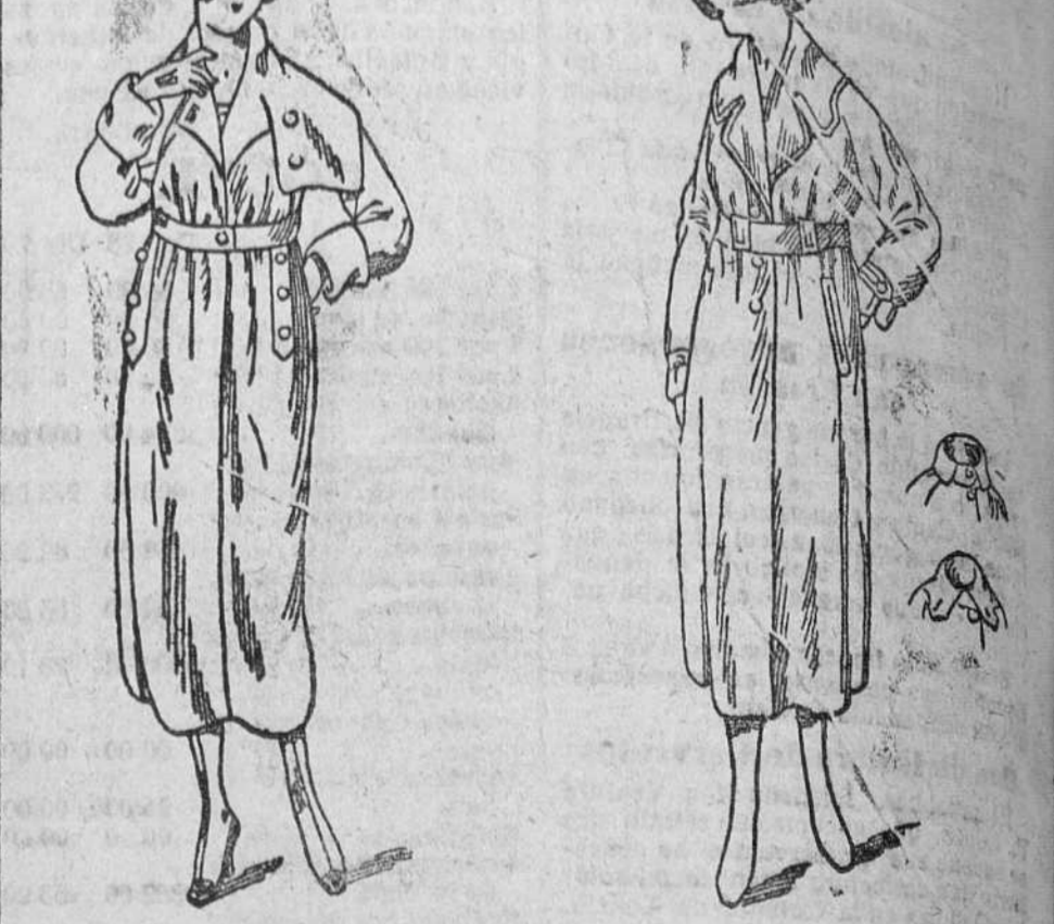
Abrigos novedad, en gamuzas, desde 35 á 150 pts. Gabardinas señoras, desde 100 á 140 pts.

Primera casa en confecciones de caballero, señora, niños y niñas