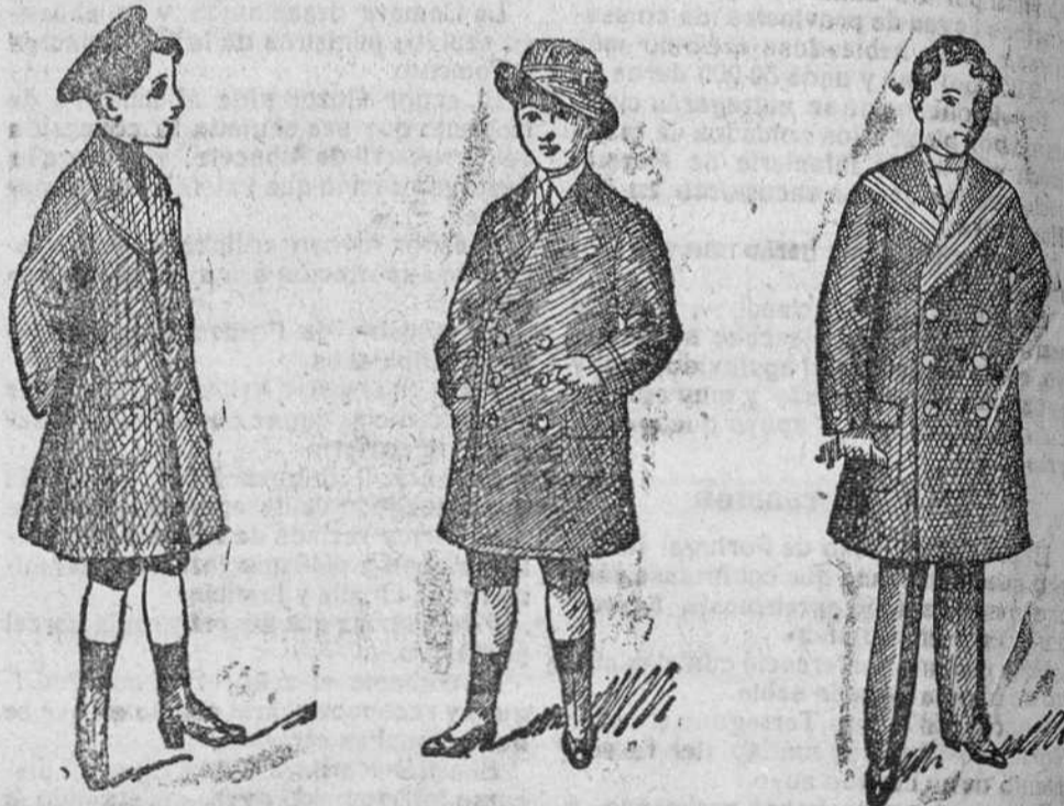
Abrigos de paño para niños, desde 20 á 50 pesetas.