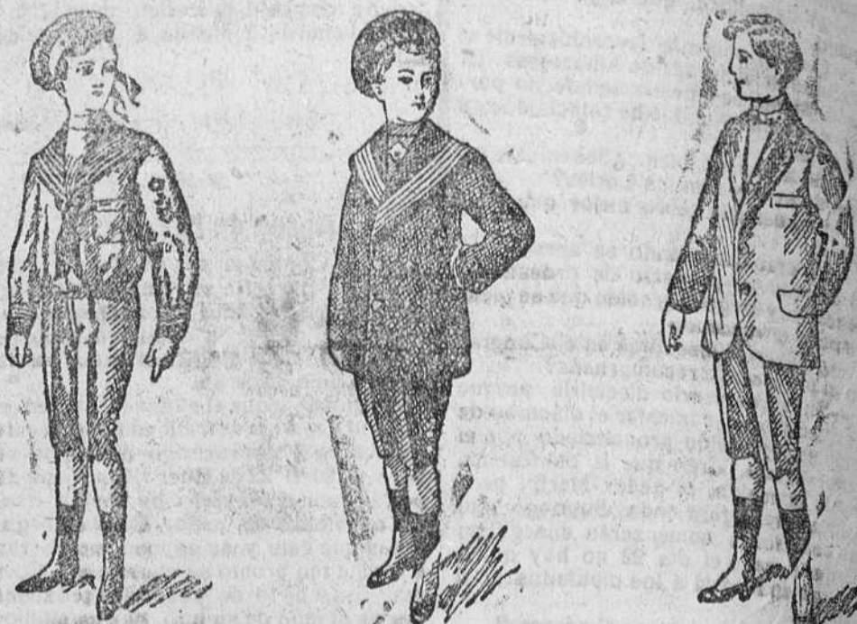
Trajecitos vicuña azul á 15, 17 y 20 pesetas.

Primera casa en confecciones de caballero, señora, niños y niñas