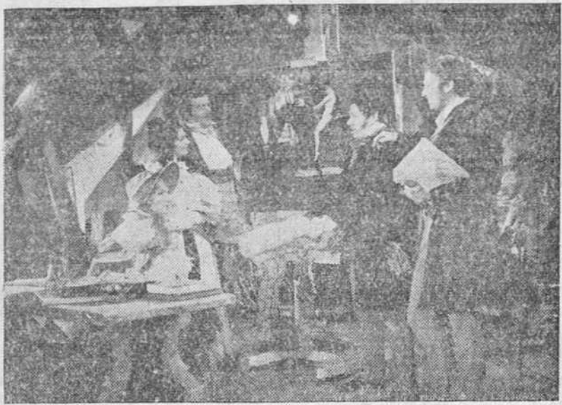
Una escena de la producción B. I. P. "MIMI", que presenta la prestigiosa marca Cifesa en la actual temporada