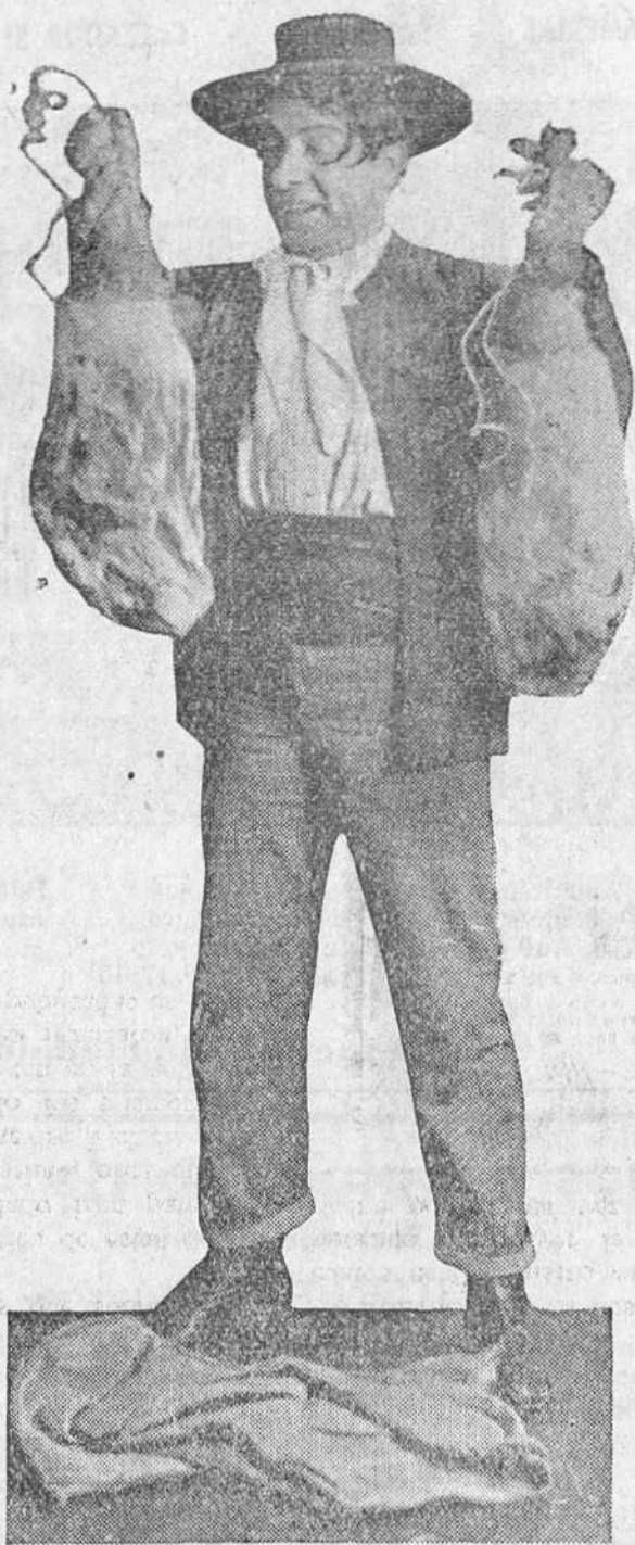
El popular actor Miguel Liger en el "rol" de "Regalito", de la gran superproducción Cifesa "MORENA CLARA", dirigida por Florian Rey