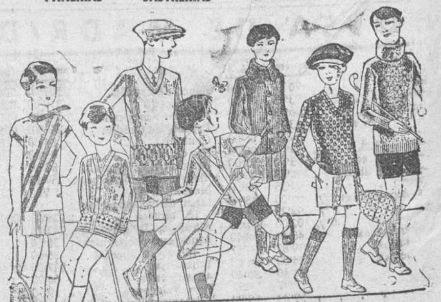
Gerseys punto, para niño, diversidad de dibujos y colores A 4, 5, 6, 7, 8 y 10 pesetas

Primera casa en tejidos y confecciones para caballero, señora, jóvenes y niños PAÑERIAS - SASTRERIAS - CALZADOS SEGARRA