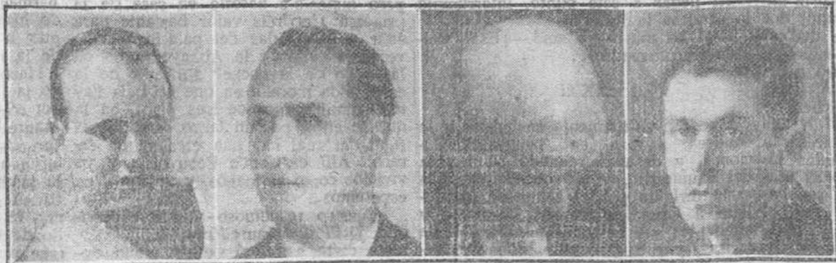
14 años calvo

El inventor del CAPILAR J. MOURADE, universalmente conocido por sus maravillosas curas (muy conocido en España por haber curado una infinidad de casos rebeldes de calvicie), estará el JUEVES, VIERNES y SÁBADO en esta ciudad, en el HOTEL PARIS, donde recibirá las consultas de los interesados en su maravilloso específico, exponiendo los casos curados, después de 30 años de calvicie.