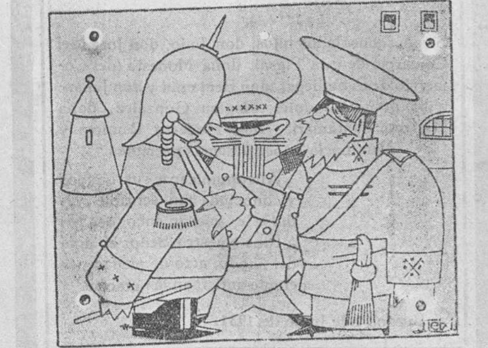
EL ORDEN DE FACTORES...

Mire usted por dónde los sin trabajo seremos ahora nosotros.