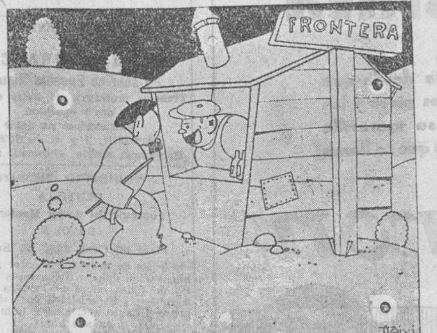
LOS GRANDES NEGOCIOS