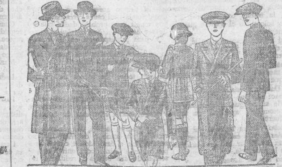
TRAJES Y TRINCHERAS para jovencitos de 10 a 18 años, en diferentes modelos, de paño, dril y lanilla de 25, 30, 35, 40, 50 y 60 pesetas. Confección fina y esmerada. Sastrería y pañería / Corte moderno. La casa que más surtido presenta y la que más barato vende.

Siempre grandes existencias encontrarán en la Casa Munguía Plaza Mayor, 42, y Lain-Calvo, 9 y 11.-BURGOS