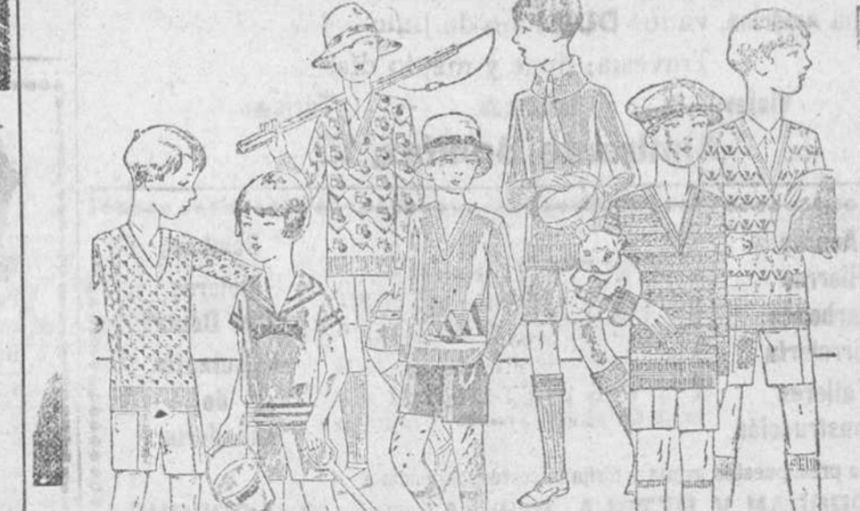
Jerseys y pullover novedad, en lana y algodón, de 4 a 10 pesetas. Modelos y colores novedad. Pantaloncitos cortos de paño, pana, dril y terciopelo.