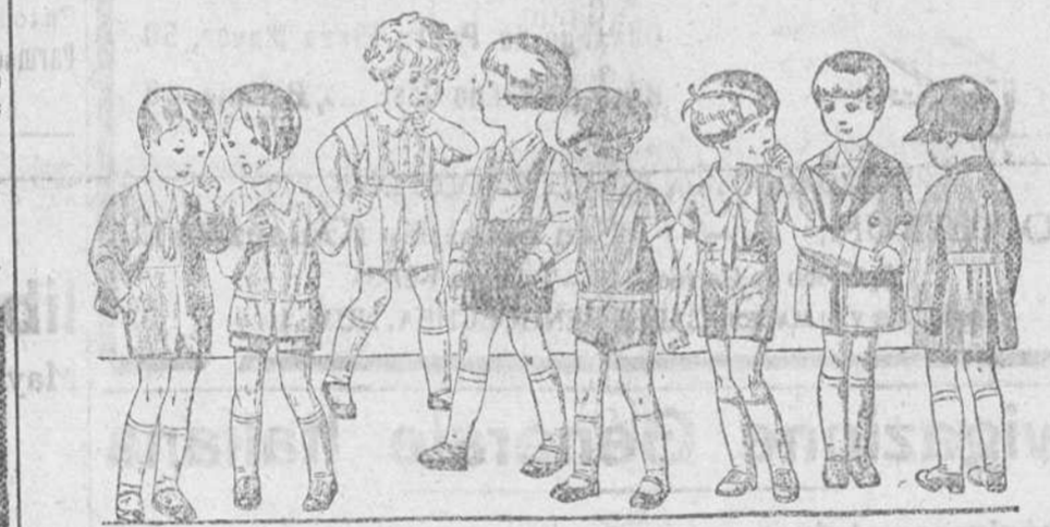
20 diferentes modelos de peles y trajecitos para niños de 2 a 5 años, en terciopelo, dril, lana y otomán, a 3'50, 4, 5, 6, 8 y 10 pesetas.

PARA CABALLERO, SEÑORA, JOVENES Y NIÑOS. SASTRERIA Y PANERIA T LEFONO 603 E. Establecimiento Oficial del Turing Club Español