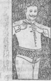
FAJA DE CABALLEJO