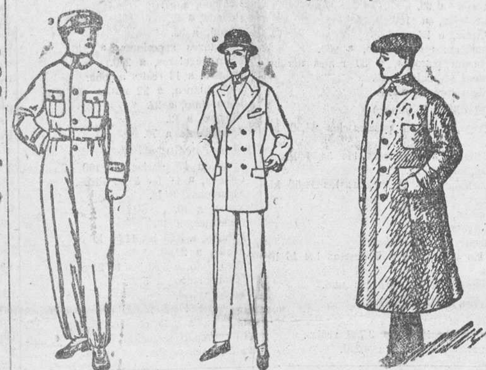
Buzos azules, color kaki y blancos, a 8, 10 y 15 ps. Trajes de confección fina, a 50, 60, 70 y 80 ps. Guardavientos en color gris y kaki, de 7 a 20 ps.