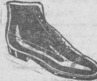
Botas en negro y color, todo cosido 19'50 pesetas