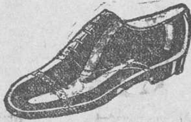
Zapatos en cinco colores distintos 18 pesetas Zapatos de charol 19'50 pesetas