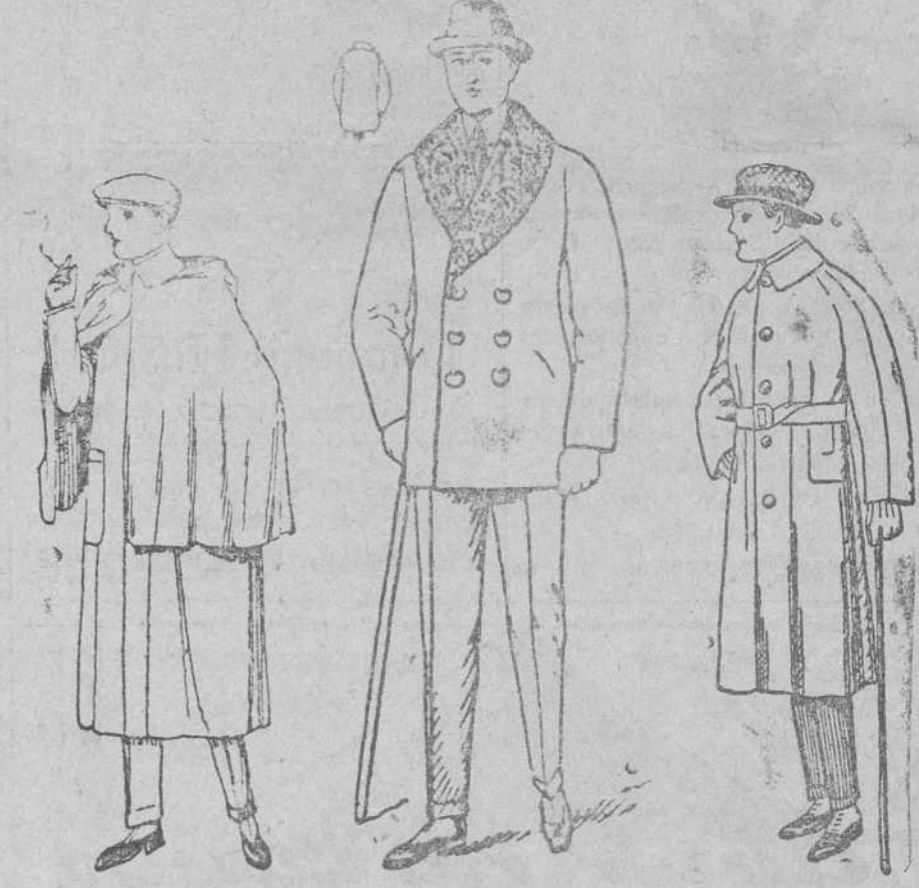
Impermeables esclavina desde 90 a 150 pesetas Pellizca cuello rizo en paño castor desde 20 a 125 pesetas Trincheras desde 20 a 100 pesetas 2.000 trincheras, desde 20 a 100 pesetas

Establecimiento Oficial del Turin Club Español