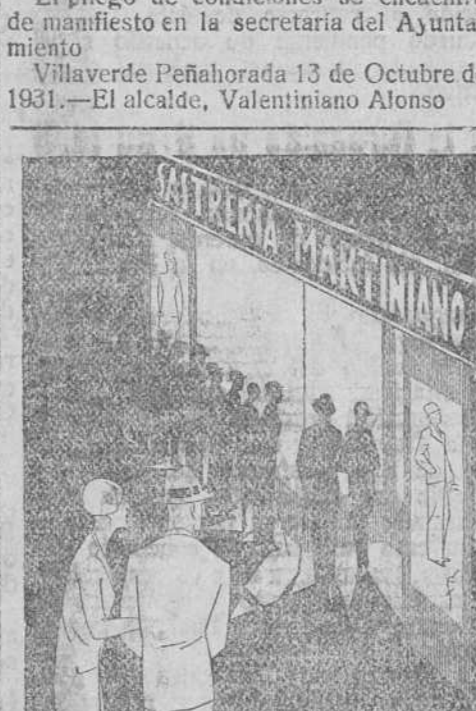
Se han recibido los géneros para la próxima temporada.