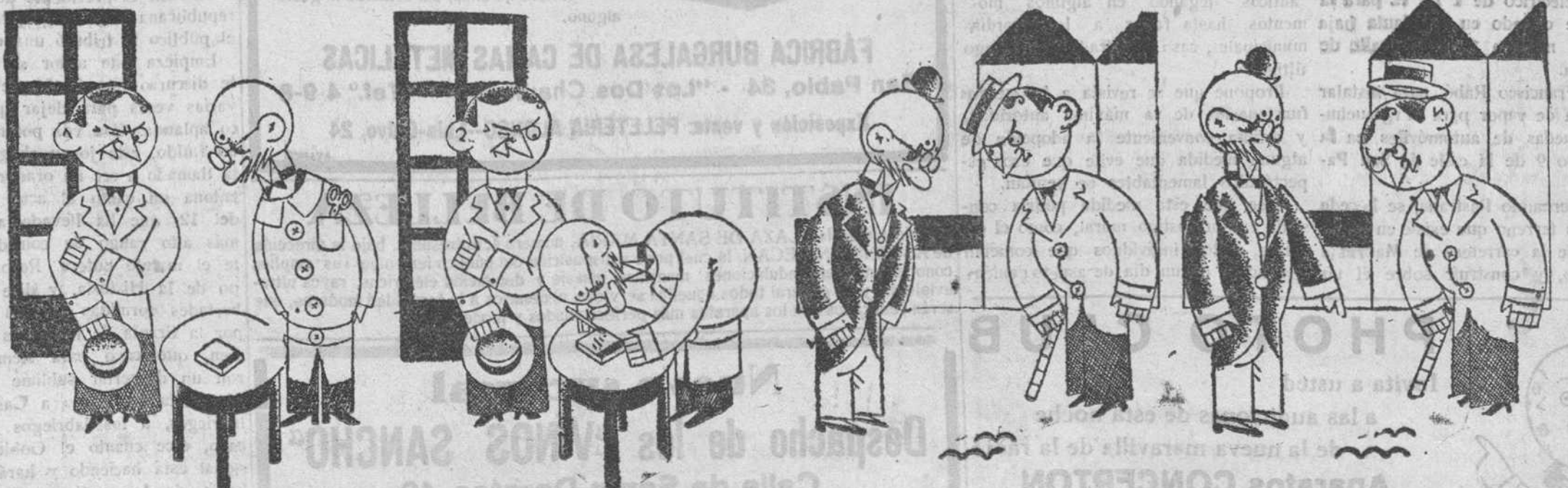
—Sí, doctor; siento unos dolores horribles en el hombro.

EN LAS CABEZAS DE PARTIDO y pueblos importantes de la provincia