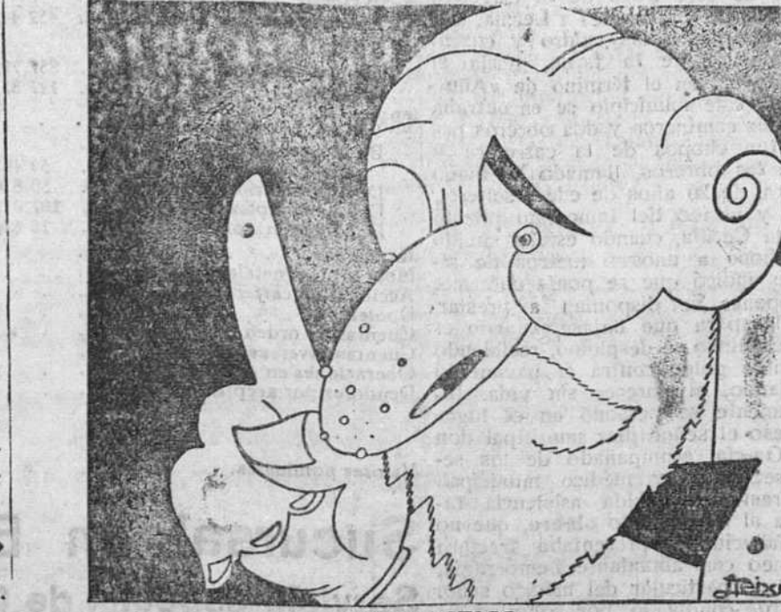
DIAGNOSTICO El doctor.—¿Cómo está el enfermo? Pues verá usted. España no está para muchos ruidos. La herida de la peseta no ha cicatrizado todavía, y si bien ha desaparecido la fiebre de la censura, en cambio se te ha presentado ahora una afección estudiantil que hace temer una complicación de desbarajuste agudo.

La Casa del Pueblo intervendrá en el momento y forma conveniente En la Casa del Pueblo se ha facilitado una nota dirigida a los trabajadores españoles, diciendo que la Casa del Pueblo de Madrid, hondamente impresionada por los luctuosos sucesos ocurridos ayer en la corte, protesta enérgicamente contra la desahucada intervención de la fuerza pública en los sucesos de referenciados, a la vez que expresa sus sentimientos solidarios con la Federación Universitaria Escolar, que con singular acierto pide la destitución del actual director de Seguridad, principa causante de los sucesos, y al mismo tiempo cumple el deber de recomendar a la clase trabajadora en general que tienda con igual disciplina y seriedad que lo hizo siempre las instrucciones emanadas de sus organismos respectivos, en evitación de actuaciones promovidas por quienes mejor o peor intencionados pueden guiar a los trabajadores por derroteros inconvenientes a las aspiraciones sentidas