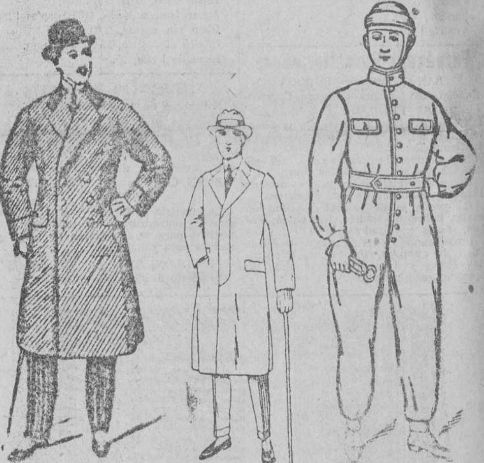
Gabanes col r. dibujo novedad, a 60, 70, 80, 90, 10, 11 y 125 pts. Corte moderno Gabanes para jovencito: desde 30 a 75 p. s. Buzos azul y k. kl. a 8, 10, 12, 15, 20 y 23 pts. Precios de fabrica

Siempre grandes existencias encontraran en Casa Munguia Plaza Mayor, 42, y Lain-Calvo, 8 y 11.—BURGOS Papel blanco e Impreso Se vende en la Administración de este periódico.