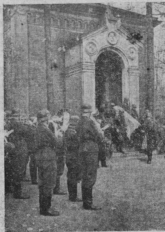
La tripulación de un avión inglés derribado por la D. C. H. berlinesa, es enterrada en un cementerio de la capital del Reich. Una banda militar alemana rinde honores a los caídos al salir del cementerio uno de los ataudas cubierto con la bandera inglesa.