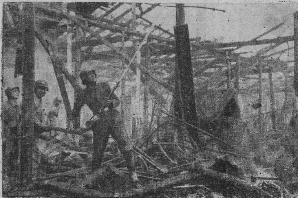
BOMBARDEOS INGLESES EN ALEMANIA