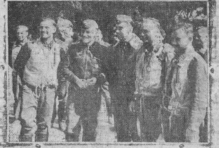
El comandante laureado Moldas, con guerrero de cuero y cuello blanco, y los camaradas de su escuadrilla de cazas, muestran su gran alegría por la última victoria lograda contra los cazas ingleses.

Las esquelas de defunción se admiten en este periódico hasta las dos de la madrugada