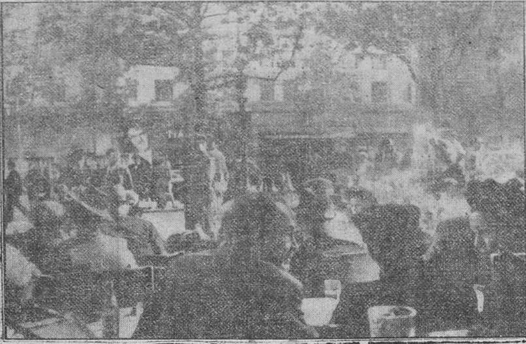
En los boulevares de París, la vida de la capital francesa recobra su normalidad. He aquí un café en los campos Eliseos, que presenta la mayor animación y tranquilidad