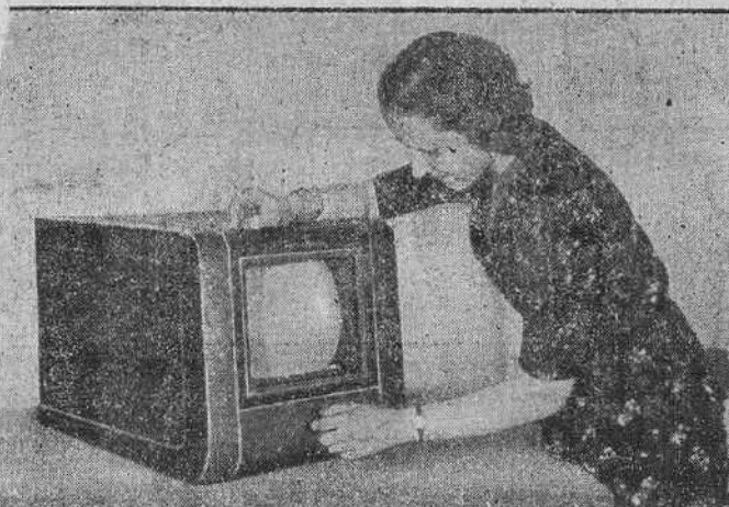
El nuevo receptor de mesa de televisión tipo Telefunken TF 1, un aparato suplementario para el radioreceptor