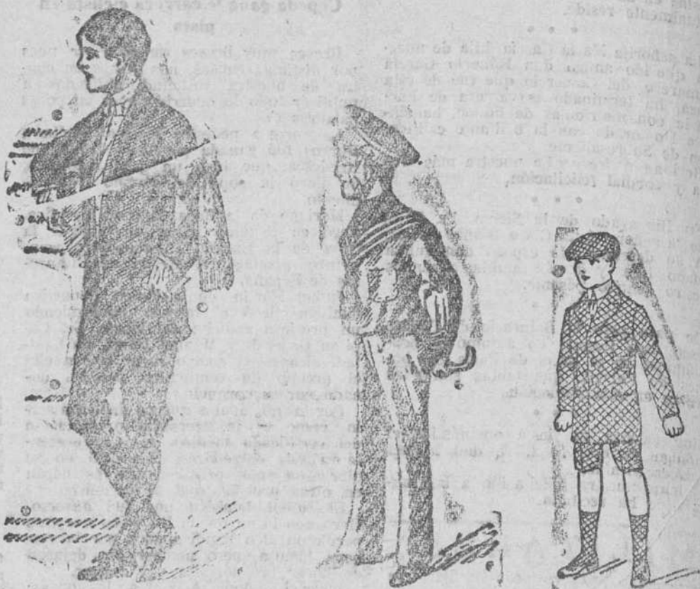
Trajes primera comunión, en dril blanco, alpaca y lana. de 30 a 60 pesetas. Trajecitos jerga azul, pantalón largo, de 30 a 50 pesetas Trajecito cuadros a 15, 18 y 25 pesetas.

Plaza Mayor, 49, y Isla de Ibañeta, 9. Teléfono número 51. Burgos Gran casa de téjidos, pañerías y confecciones de caballeros, señoras y niños