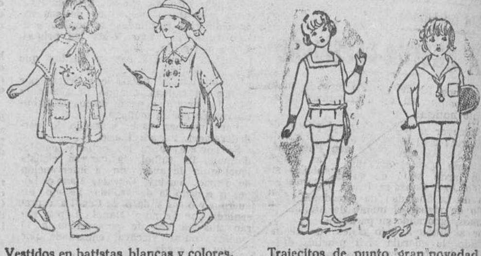
Vestidos en batistas blancas y colores, a 5, 6, 8 y 10 pesetas. Trajecitos de punto, gran novedad, a 8, 10 y 12 pesetas Precio fijo verdad. Todos los artículos marcados.