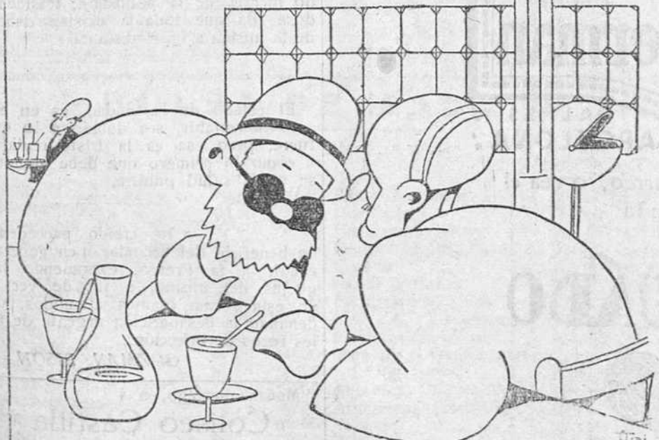
Dicen que ha sido un crimen horroroso... Figúrate si le darían puñaladas al pobre, que no se ha podido encontrar el cadáver.

Se encuentra enfermo nuestro buen amigo el exdiputado a Cortes don Diego de Saavedra y Gaitán de Ayala. Hacemos votos por su pronto restablecimiento.