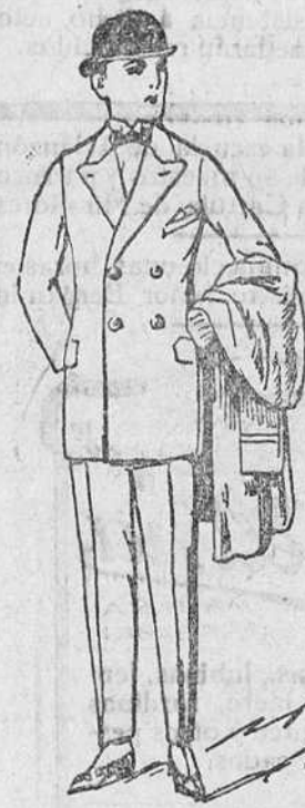
Trajes americana cruzada, paño melton de 50 á 120 pesetas.

Gran casa de tejidos, pañería y confecciones de caballero, señora y niños