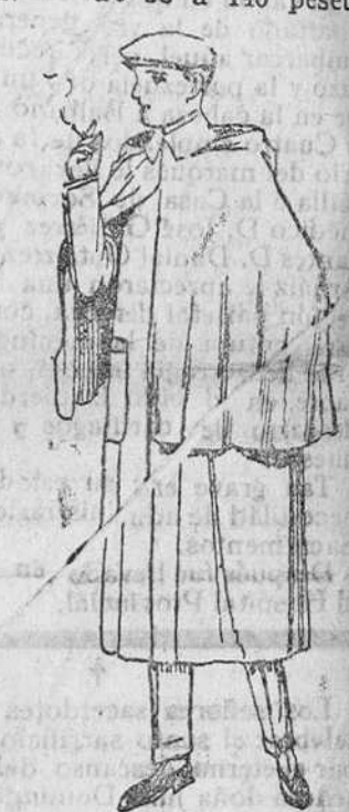
Impermeables á 110, 115 y 125 pesetas.

Precio fijo verdad. Todos los artículos marcados.