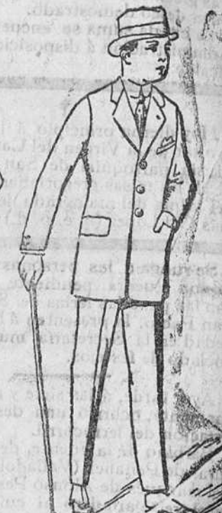
Trajes americana sport en paño, dril y pana de 35 á 140 pesetas