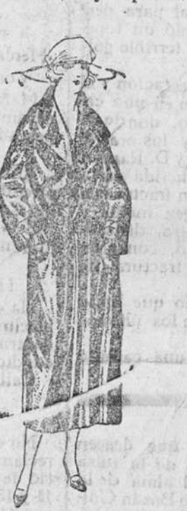
Gabardinas novedad, á 90, 100, 115, 125 pts. impermeables seda de 100 á 160 pts.