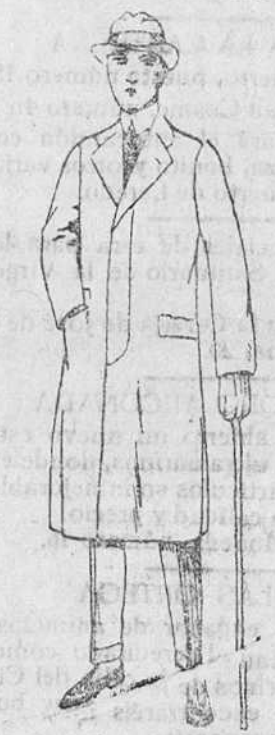
Gabardinas de lana, desde 90 á 160 pesetas.