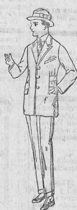
Trajes de dril á 28, 30, 35, 40 y 50 pesetas.