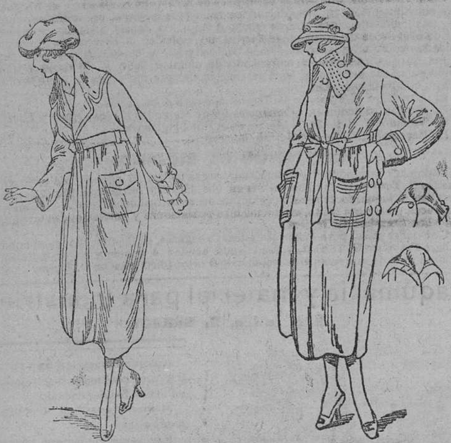
Abrigos de señora, en paños gamuzas, á 35, 40, 45, 50, 60 y 70 pesetas. Abriguitos de niñas á 10, 12, 15, 18, 20 y 25 pesetas.

Gran ocasión, como fin de temporada, en abrigos de señora y niñas.