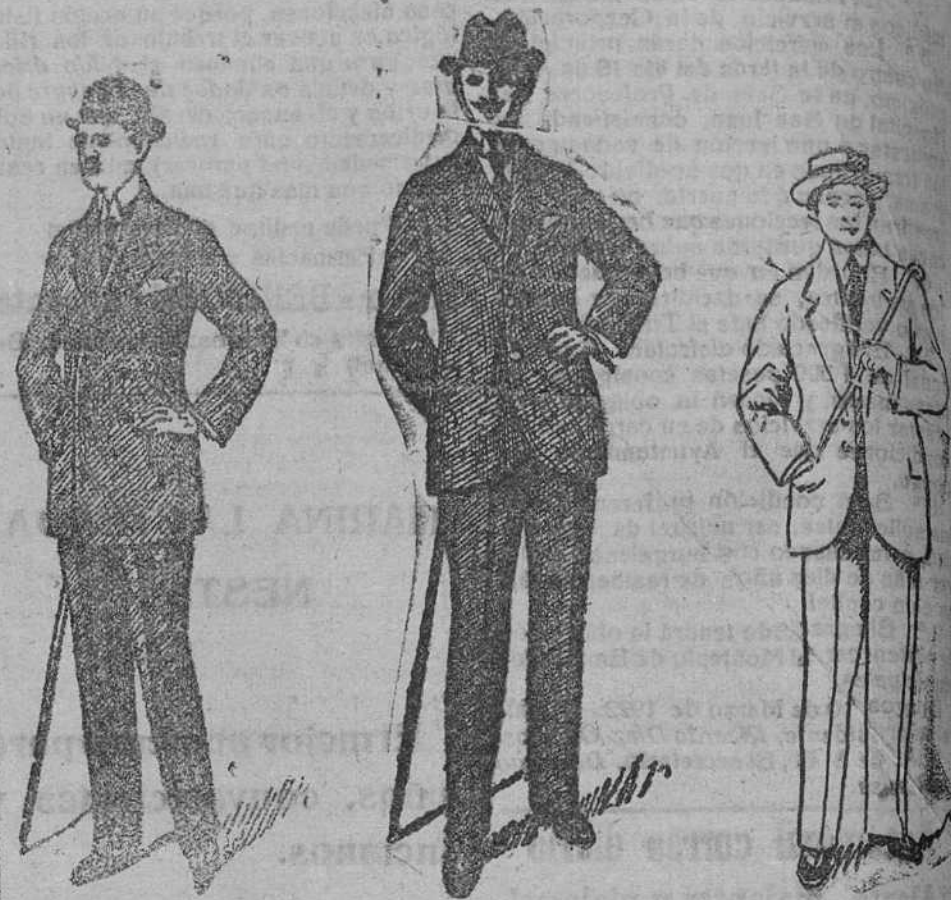
Trajes de paño melton, americana cruzada, á pts. 60.

Grandes surtidos en trajes de caballero, jóvenes y niños.