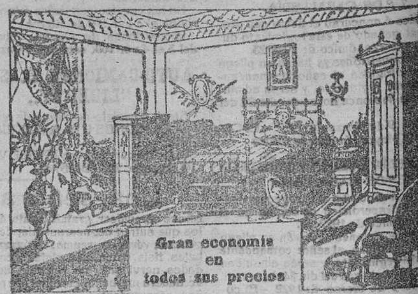
Gran economía en todos sus precios

Antes de comprar camas y muebles visite esta casa para convencerse de su baratura