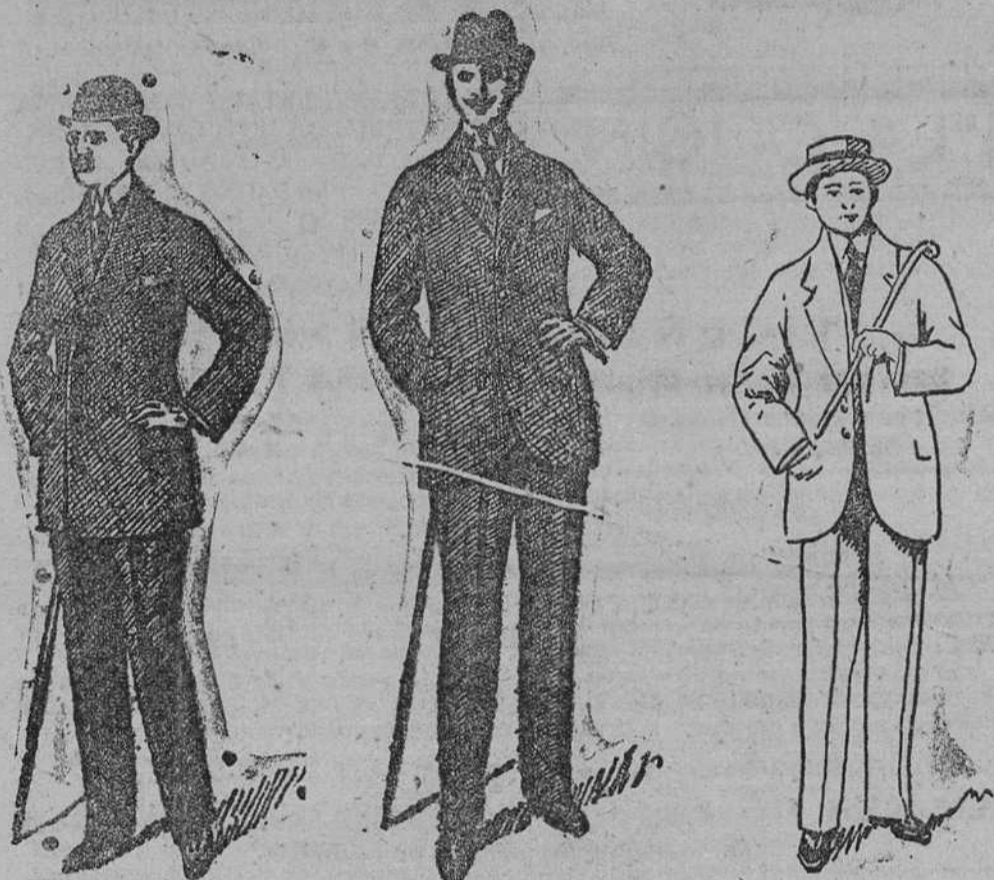
Trajes de paño melton, americana cruzada, á pts. 60.

Grandes surtidos en trajes de caballero, jóvenes y niños.