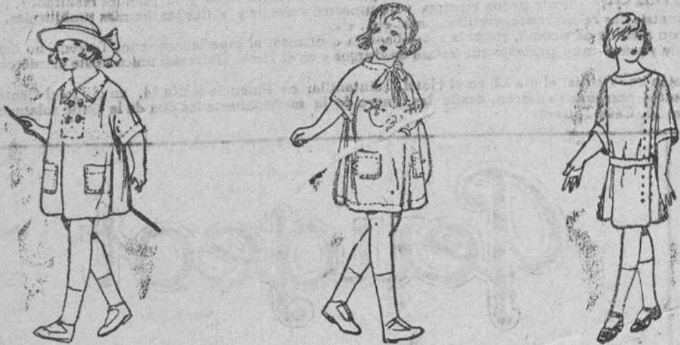
Diversidad de modelos en vestiditos de percal y batista, 2'50 a 10 pesetas.

Gran casa de todos, pañería y confecciones de caballero, señora y niñas