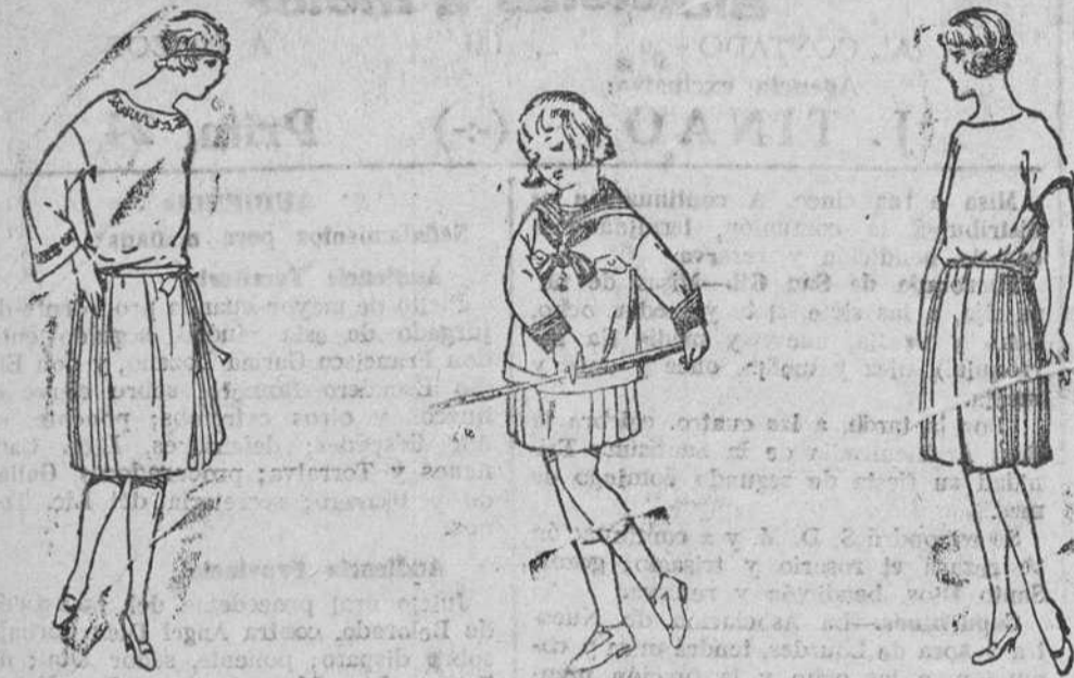
Diversidad de modelos en vestiditos de lana, de gran novedad, para niños y jovencitas.

Precio fijo verdad. Todos los artículos marcados.