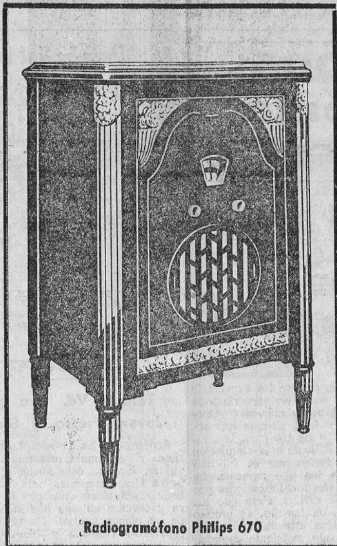
Radiogramófono Philips 670

Oígalos en la Representación Oficial de,