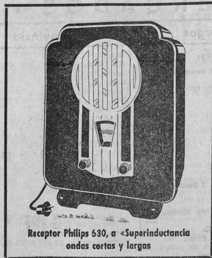
Receptor Philips 530, a «Superinductancia ondas cortas y largas»

Tenga en cuenta esto el decidirse a adquirir un receptor, y deducirá que solamente Philips puede ofrecerle la garantía de su perfecto funcionamiento, la bondad técnica de todos sus componentes fabricados por Philips, y sus inmejorables válvulas «Miniwatt» mundialmente conocidas por su duración y rendimiento.