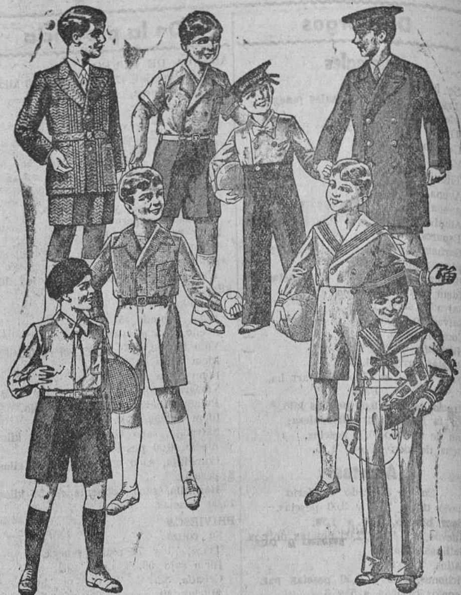
Trajecitos, modelos novedad, de 15, 18, 20, 25 y 30 pesetas

Primera casa en confecciones para caballero, señora y niños Plaza Mayor, 43, Lain-Calvo, 9 y 11.—Sucursal: Plaza Mayor, 8, Burgos Teléfono, 603-R