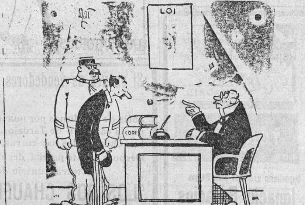
—Se le acusa de haber tenido una sala de juegos de azar. —Perdón, señor juez; era una agencia matrimonial. —Es lo mismo.