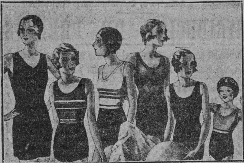
Trajes de baño en lana o algodón para señora, caballero o niños Pantalón de baño a 1,50, 1,75, 2 y 2,50

Primera casa en confecciones para caballero, señora y niños Plaza Mayor, 41. Lain-Calvo, 2 y 4. Sucursal: Plaza Mayor, 5, Burgos