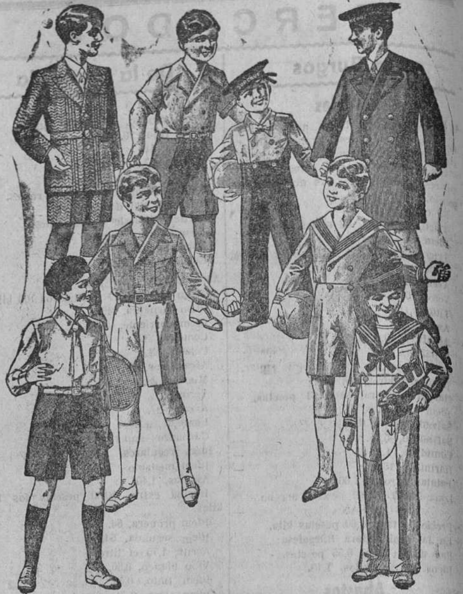
Trajecitos, modelos novedad, de 15, 18, 20, 25 y 30 pesetas La Casa que más surtido presenta y más barato vende

Primera casa en confecciones para caballero, señora y niños. Plaza Mayor, 42. Lain-Calvo, 2 y 11.—Savursal: Plaza Mayor, 8, Burgos