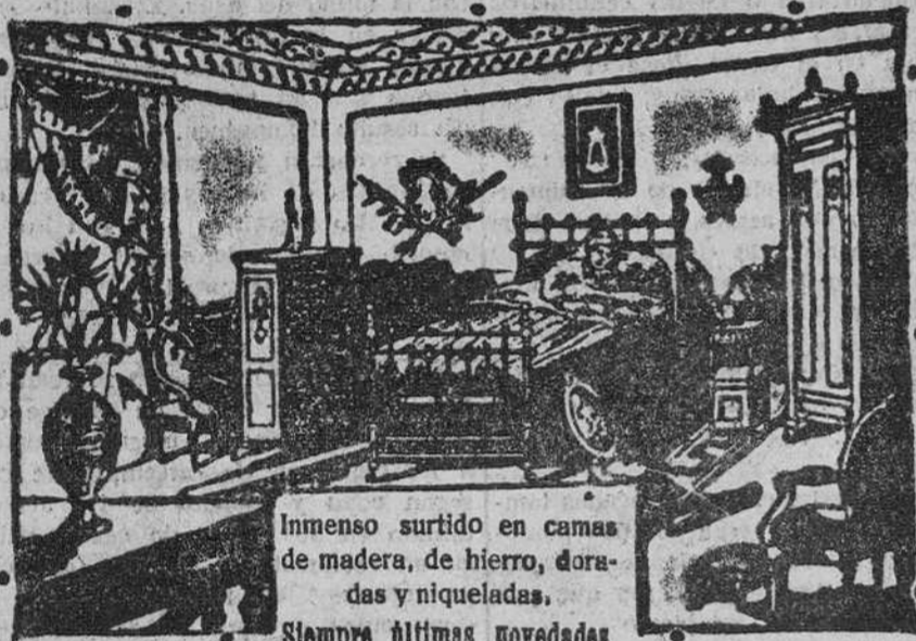
Inmenso surtido en camas de madera, de hierro, doradas y niqueladas. Siempre últimas novedades.

Visite el nuevo sommier, todo hierro modelo patentado. Es muy ligero, fortísimo y muy económico.