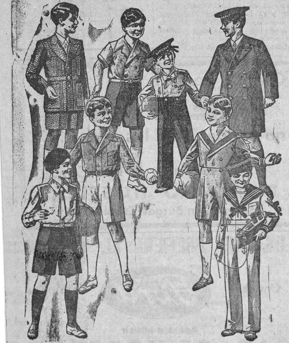
Trajecitos, modelos novedad, de 15, 18, 20, 25 y 30 pesetas La Casa que más surtido presenta y más barato vende

OBRAS DE RAFAEL PEREZ Y PEREZ Autor de «Inmaculada» Adquiera usted las obras completas de RAFAEL PEREZ Y PEREZ, 10 extraordinarias novelas de 400 páginas, abonando 41,50 pesetas en cuatro plazos mensuales. Si el pago se hace al contado, recibirá gratis un precioso mueble-biblioteca. RAFAEL PEREZ Y PEREZ domina, como nadie, el secreto del interés; sus novelas son hondamente emotivas. Delectan extraordinariamente, cautivan y entusiasman. Toda la Prensa de España ha hecho de sus obras el más caluroso elogio. «BIBLIOTECA PATRIA».-Fuencarral, 138, MADRID Don . . . . . domicilio en . . . . . calle . . . . . núm. . . . . acepta las obras completas de RAFAEL PEREZ Y PEREZ, y su importe lo abonará (indíquese a plazos o al contado). FIRMA