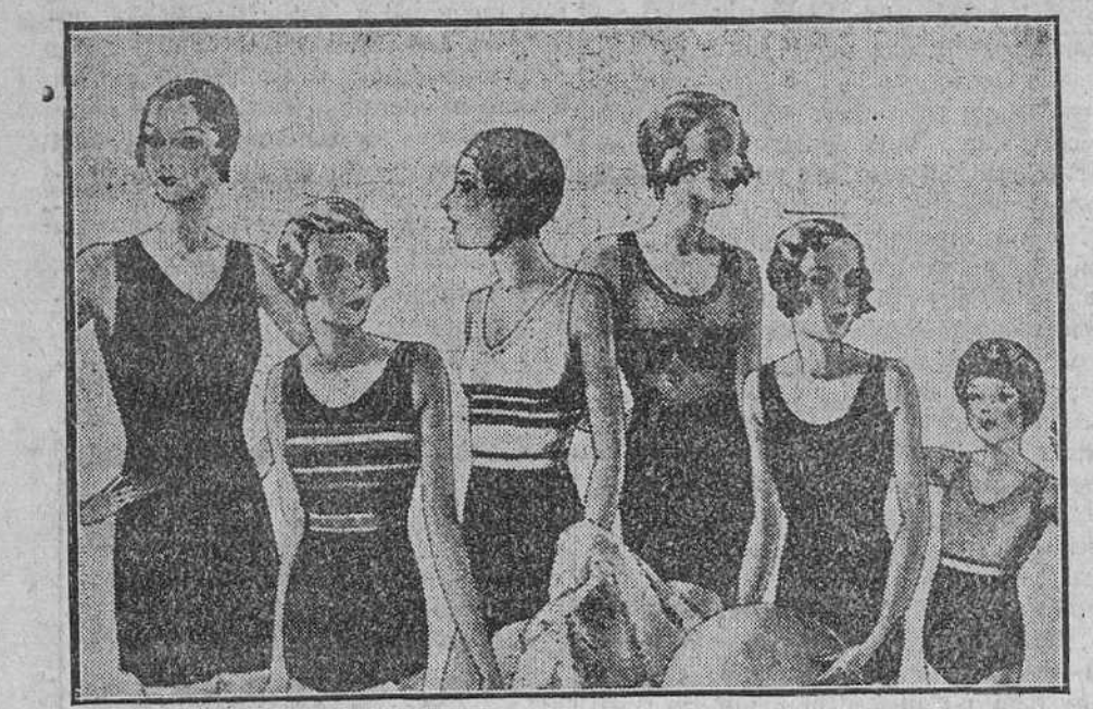
Trajes de baño en lana o algodón para señora, caballero o niños Pantalón de baño a 1,50, 1,75, 2 y 2,50

Casa Munguía Primera casa en confecciones para caballero, señora y niños Plaza Mayor, 49, Lain-Calvo, 9 y 11. - Sucursal: Plaza Mayor, 8, Burgos Teléfono, 603-R