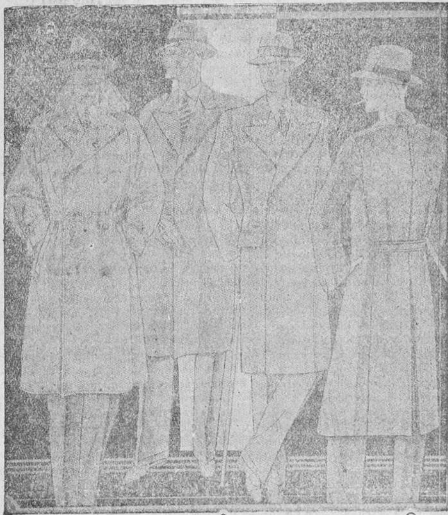
Abrigos novedad, corte moderno desde 35 pesetas a 200 uno. Colores y dibujos modernos.

Plaza Mayor, 49. Lain-Calvo, 4 y 11.—Sucursal: Plaza Mayor, 8, Burgos