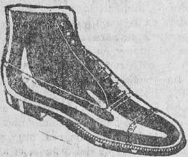
BOTAS Todo cosido a 19.50 pesetas