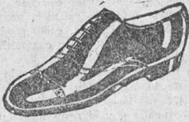
ZAPATOS Los mejores—Ultimos modelos a 18 pesetas