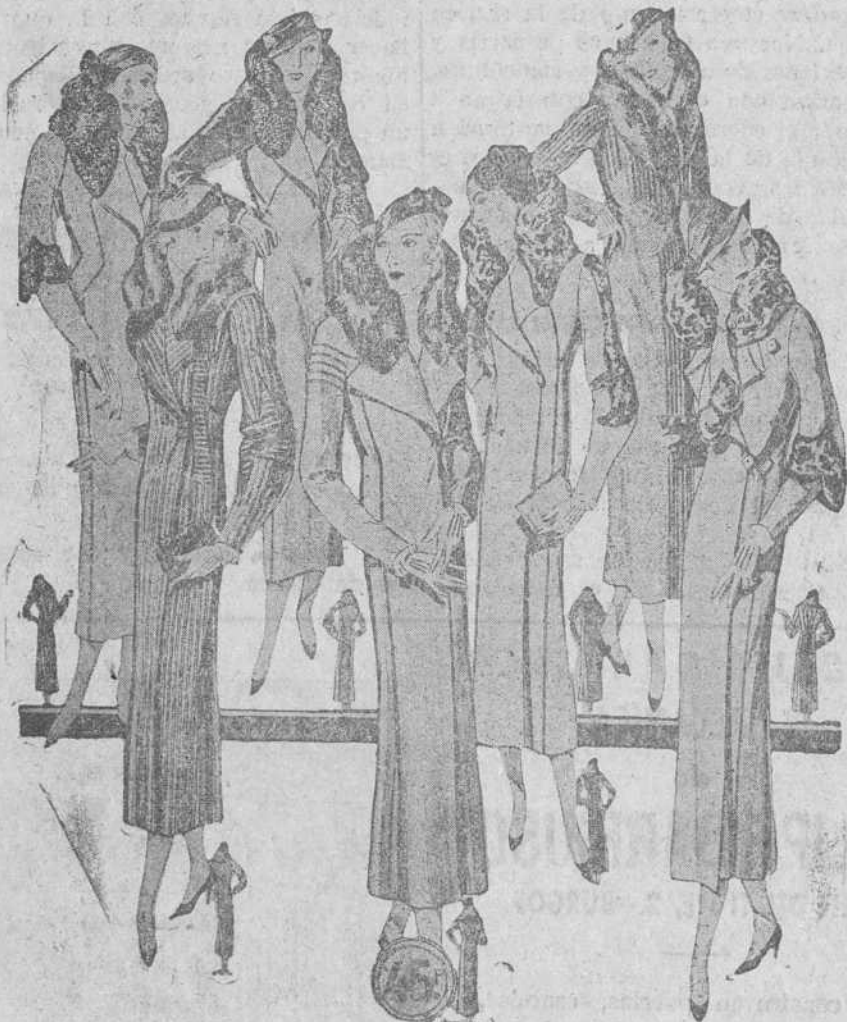
Cincuenta modelos distintos en abrigos de gamuza novedad, modelos creación de París, a 25, 30, 40, 50, 60, 70, 80, 90 y 100 pesetas.

La Casa que más surtido presenta y más barato vende