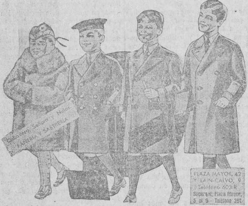
Abriguitos para niños, modelos novedad, de 15, 18, 20, 25 y 30 pesetas.

Primera casa en confecciones para caballero, señora y niños Plaza Mayor, 48, Lain-Calvo, 9 y 11.-Sucesal: Plaza Mayor 8 Burgos Teléfono, 503-R Teléfono, 284