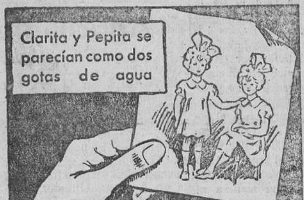
Clarita y Pepita se parecían como dos gotas de agua