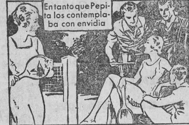
Entanto que Pepita los contemplaba con envidia