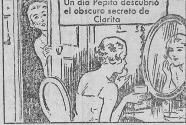
Un día Pepita descubrió el obscuro secreto de Clarita