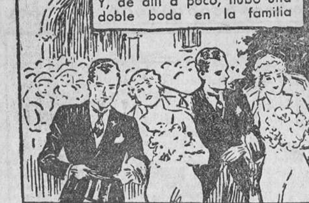
Y, de allí a poco, hubo una doble boda en la familia

El secreto de Clarita era la "ESPUMA DE CREMA" Con la cual puede Vd. bailar toda la noche en un salón caldeado—jugar al tenis toda la tarde—y conservar la tez tan fresca como al empezar. No brillo en la nariz; no rostros relucientes y grasientos; no necesidad ponerse constantemente polvos. En los Polvos Tokalon la Espuma de Crema está científicamente mezclada con los Polvos aerificados más finos según un procedimiento patentado. Gracias a esto, los Polvos Tokalon no solo se mantienen fijos cuatro veces más tiempo que los demás, sino que, además, procuran a la tez una belleza incomparable, admirada por los hombres y envidiada por las mujeres. Los compactos Tokalon contienen ahora la famosa espuma de crema. Los Polvos y el colorete son ambos sumamente adherentes. Algo nuevo, diferente y mejor.