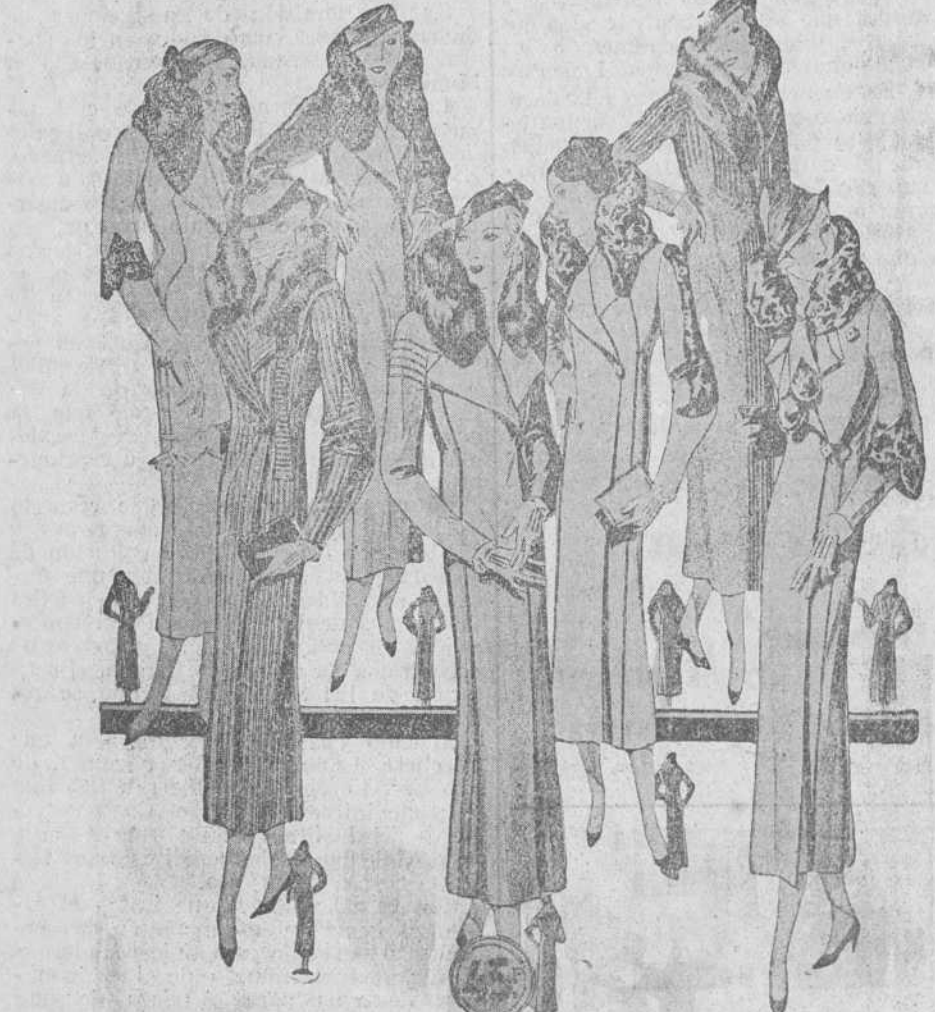
Cincuenta modelos distintos en abrigos de gamuza novedad, modelos creación de París, a 25, 30, 40, 50, 60, 70, 80, 90 y 100 pesetas.

Primera casa en confecciones para caballero, señora y niño Izda Mayor, 47, Lalt-Calvo, 3 y 4. - Sucursal: Plaza Mayor, 8, Burgos Teléfono, 283-57