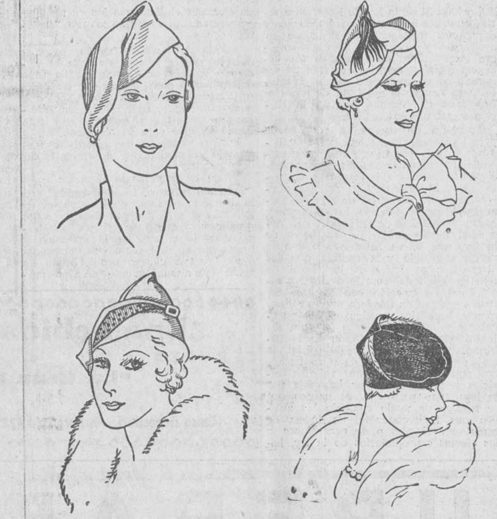
Algunos de los modelos que presenta en la actual temporada