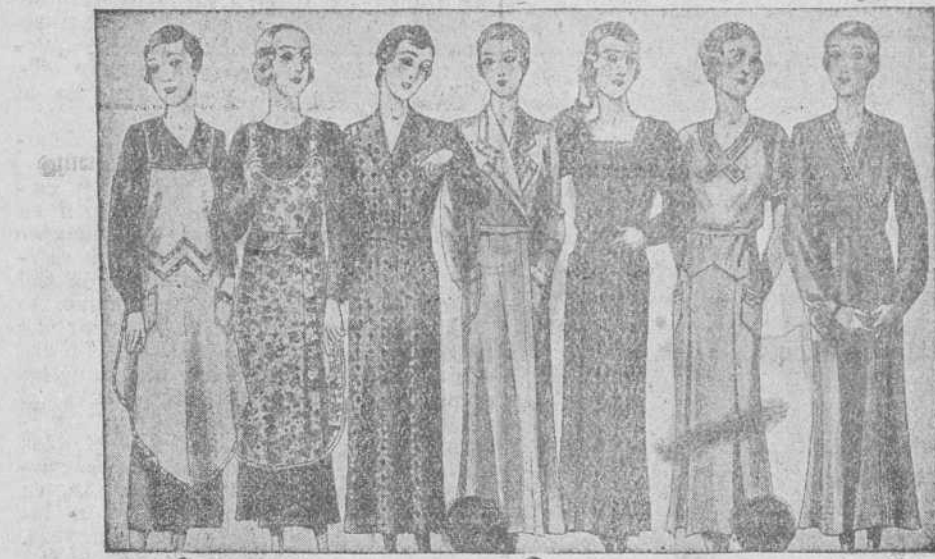
Batas y uniformes, todos los gustos, diversidad de modelos, de 8, 10, 12 y 15 pesetas. La casa que más surtido presenta y más barato vende