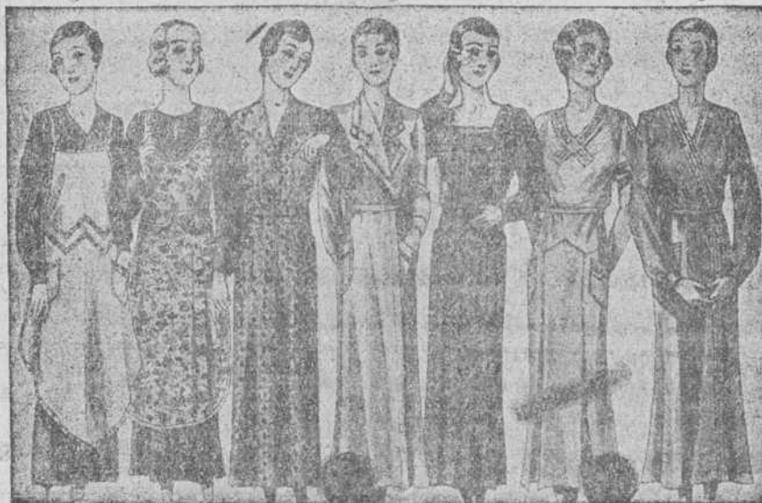
Batas y uniformes, todos los gustos, diversidad de modelos, de 8, 10, 12 y 15 pesetas.

La Casa que más surtido presenta y más barato vende