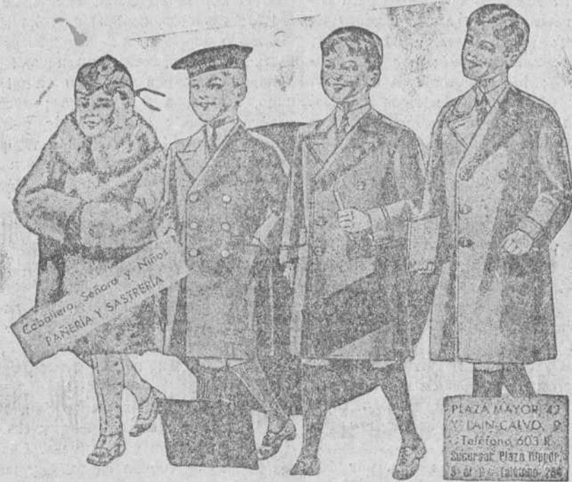
Abriguitos para niños, modelos novedad, de 15, 18, 20, 25 y 30 pesetas.

Primera casa en confecciones para caballero, señora y niños] Plaza Mayor, 43, Lain-Calvo, 9 y 11.-Sucursal: Plaza Mayor, 8, Burgos Teléfono, 883-8