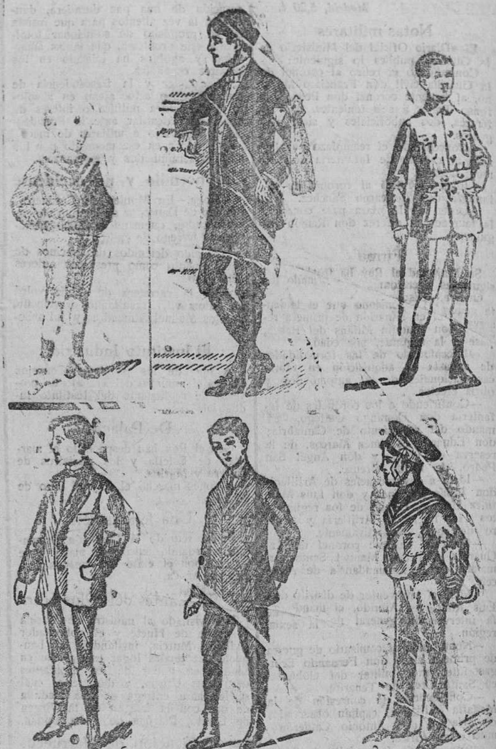
50 modelos diferentes de trajecitos de paño, pana y drill, desde 8 a 50 pesetas. Precio fijo verdad. Todos los artículos marcados.

Gran casa de teléas, pañerías y confecciones de caballero, señora y niños