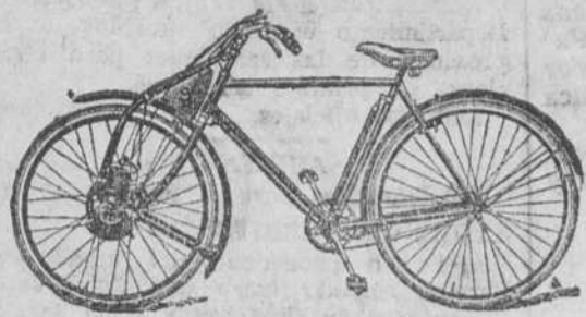
Motores para bicicletas