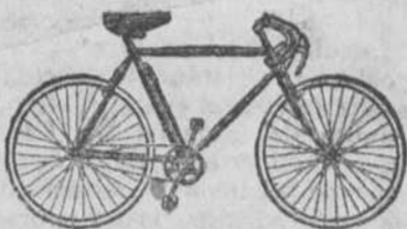
Bicicletas de paseo, desde