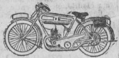
Diversidad de modelos en motos