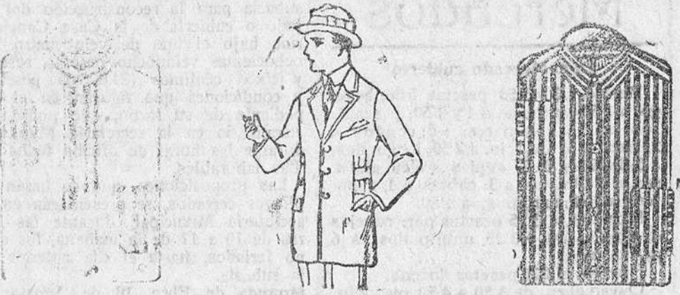
Camisas percal, a 5 y 6 pesetas.