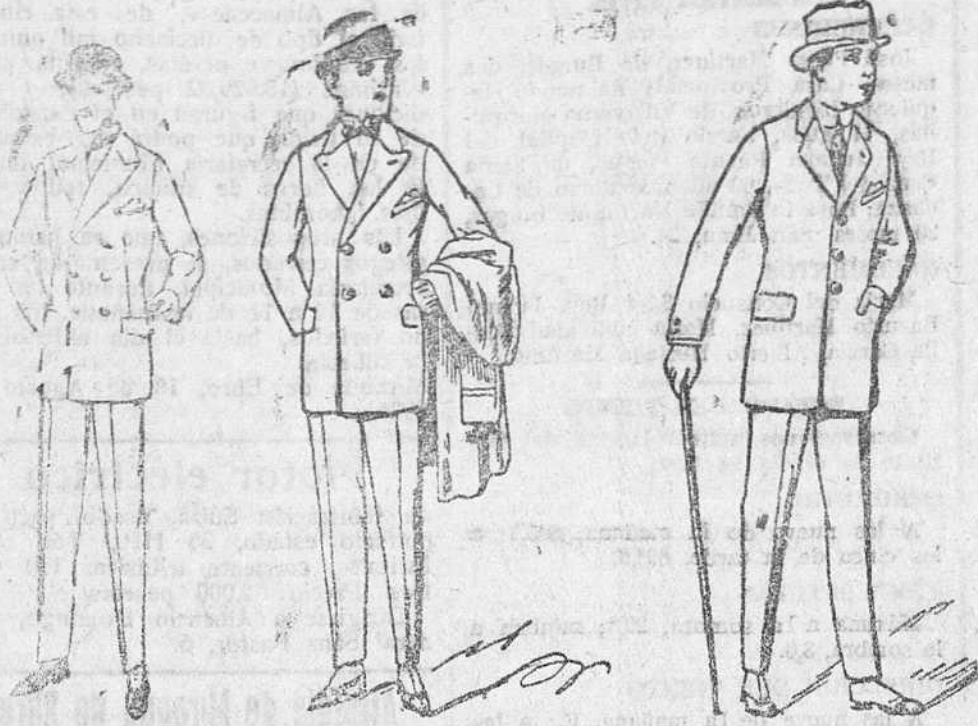
Trajes de dril gabardina, de 30, 35 y 40 pts.

Gran casa de telas, paños y confecciones de caballero, señora y niño