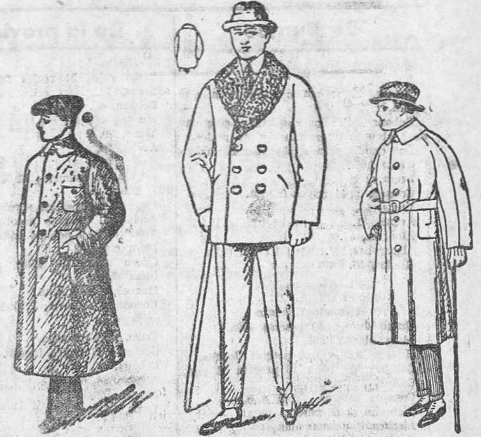
Pelizos p.ño, cuello rizo a 18, 20, 25, 30, 40, 50 y 75 pesetas. Guardapolvos de caballero a 8, 10, 12 y 15 pesetas. Gabardinas a 40, 50 y 70 pesetas. Impermeables de 25 a 75 pesetas.

Primera casa en tejidos y confecciones para caballero, señora, jóvenes y niño. PAÑERIAS - SASTRERIAS - CALZADOS SEGARRA