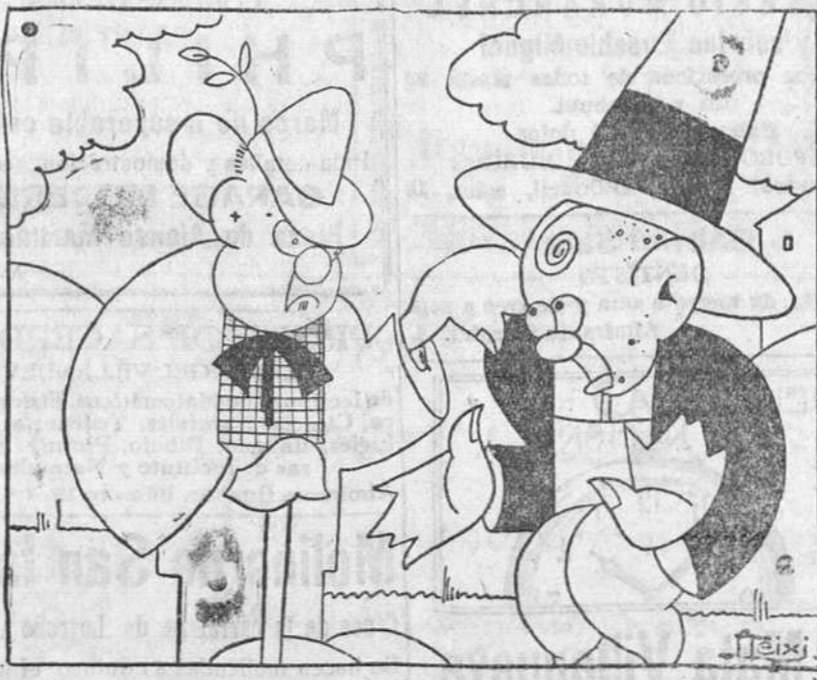
—Cuando yo trabajo todo el mundo se queda con la boca abierta. —¿Qué es usted? —Dentista.

EN LAS CABEZAS DE PARTIDO y pueblos importantes de la provincia.