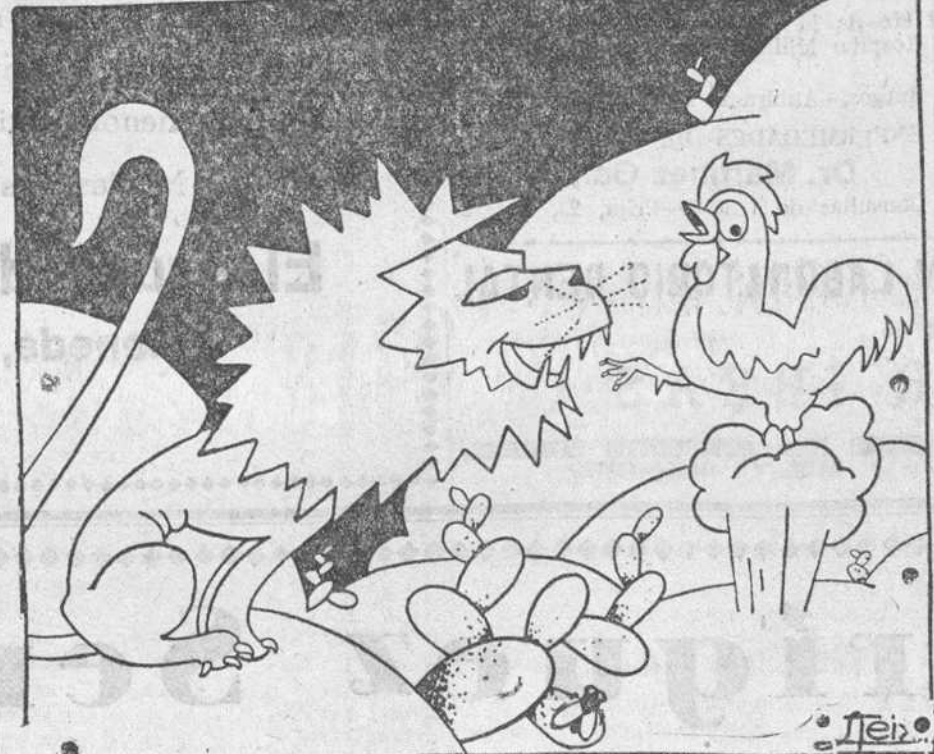
El gallo.—¡A ver si hay quien chille más que yo!