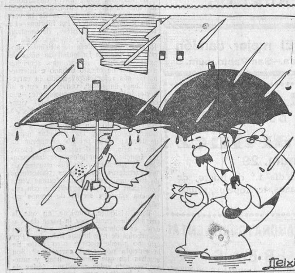
—Como estamos en estado de guerra, hasta las lluvias son generales en España

La Comisión ha aprobado ya el informe, que estudiará el Consejo de ministros. Según parece, se propone que la cédula personal se sustituya por el «carnet».