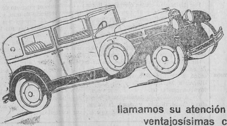
Uno de los tipos de serie del Nacional Pescara

Organizando su red de Agencias participa a los interesados que todavía quedan algunas disponibles, y por lo tanto