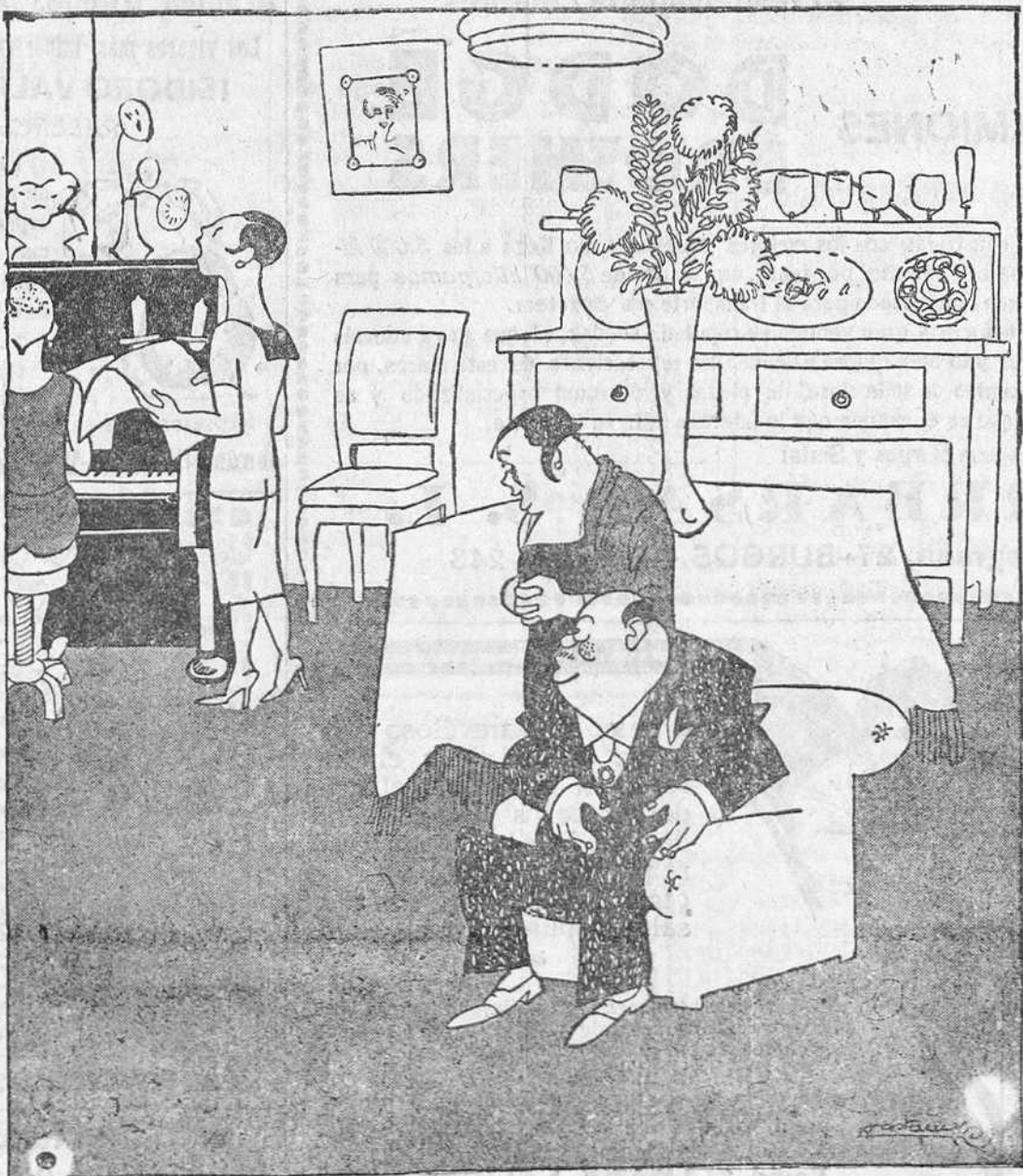
—No te parece que las niñas cada día adelantan más en el canto? —Evidente; al principio no se quejaban más que lo vecinos; hoy se queja ya todo el mundo. (Dib. Castanys—Barcelona).

ESTE NUMERO HA SIDO VISADO POR LA CENSURA