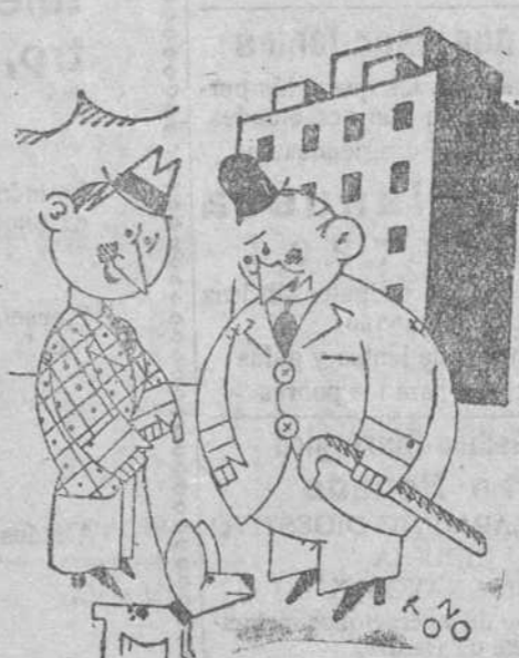
—Sí, señor. Es que me he comprado este perrito.