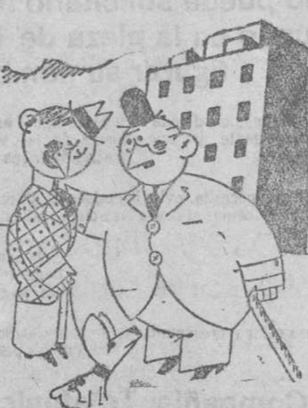
—Caramba con Vallenilla. Está usted completamente cambiado. Casi desconocido.