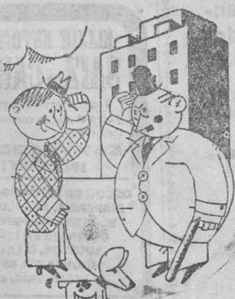
—¡Adiós, don Fulgencio! No caigo...