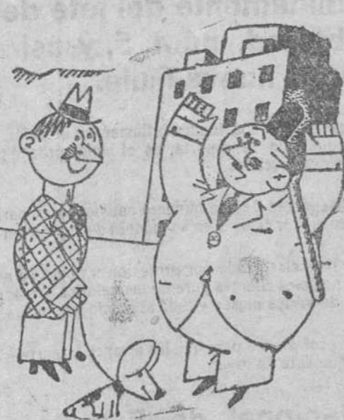
—Pero si es Vallenilla! No le había conocido.