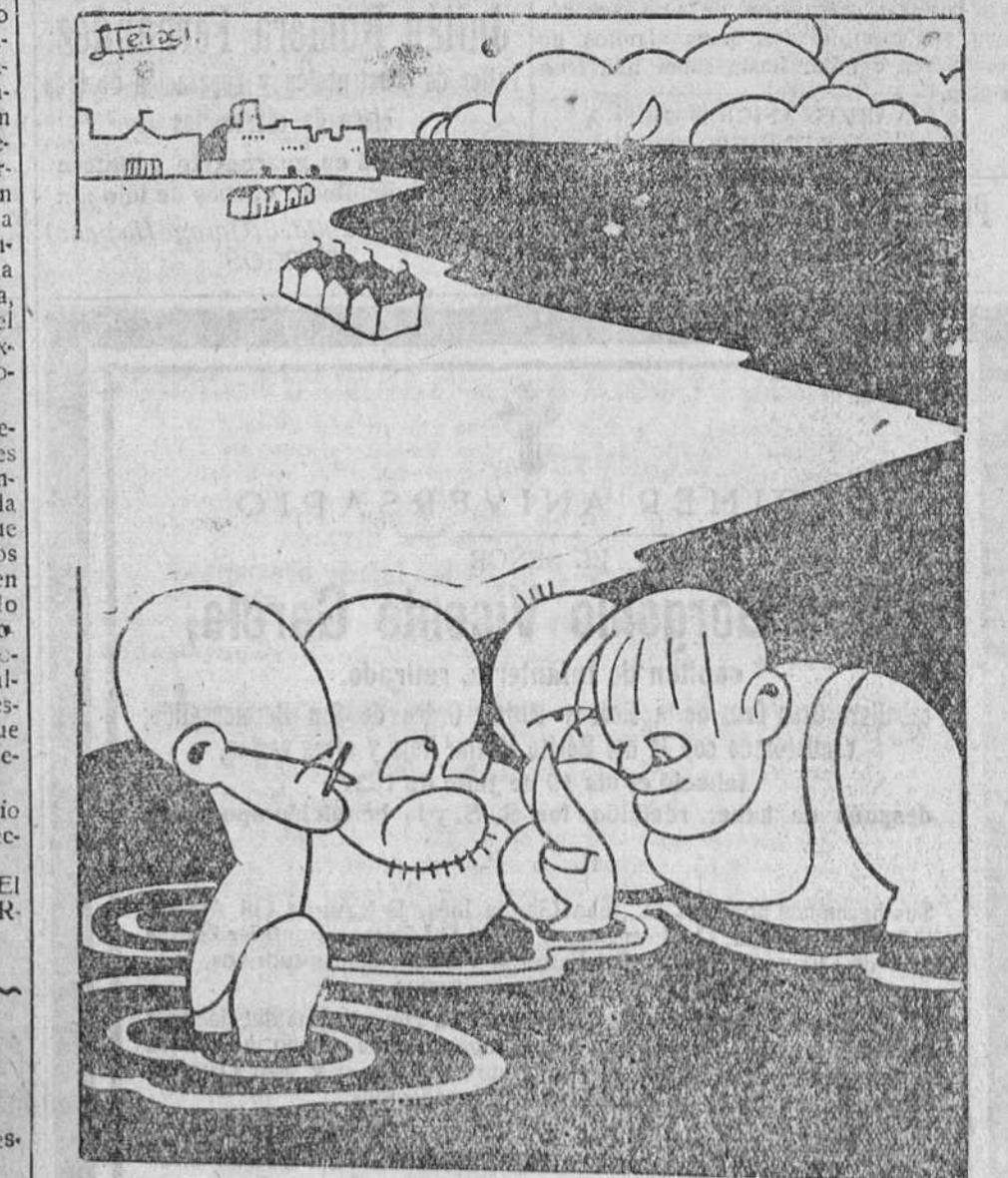
— El mar es una porquería. ¡Eso de que con la misma agua nos bañemos todos...!

Provincia de Murcia, cinco para maestro y cuatro para maestra. («Gaceta» de 19 de Julio.)