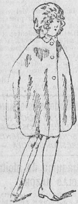
Capitas impermeables, de 8 a 20 pesetas, en negro y colores.