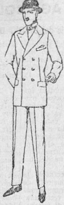
Trajes de paño, corte inglés, a 30, 90, 100 y 120 pts.