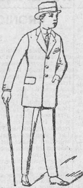
Trajes para caballero, ECONOMICOS, a 35, 40, 45 y 50 pesetas