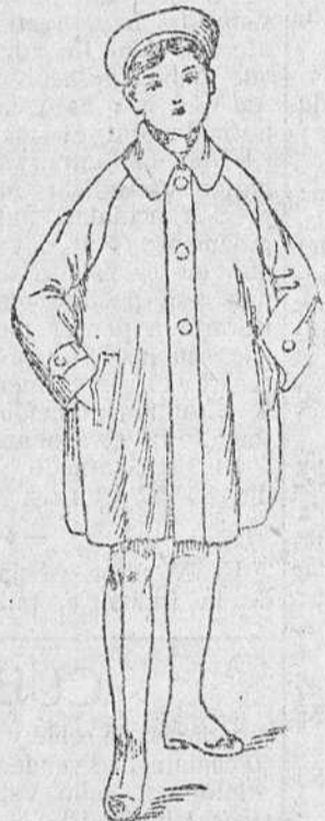
Trincheras y abrigos, a 30, 35, 40, y 50 pesetas.

Precio fijo verdad. Todos los artículos marcados.