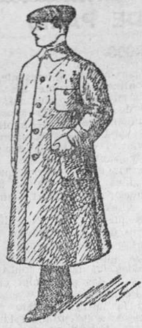
Guardapolvos en color gris y kaki, a 8 10 12 15 y 20 pesetas

Gran casa de tejidos, pañería y confecciones de caballero, señora y niños