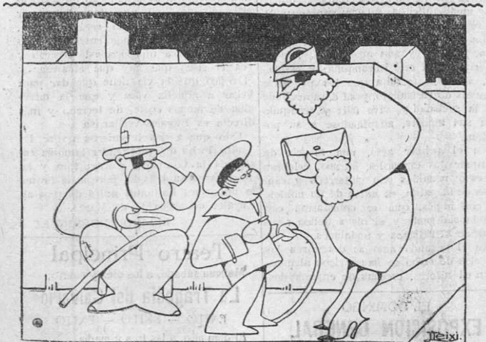
COLOCANDO SE AL NIVEL DE LAS CIRCUNSTANCIAS —Me ha dicho el jefe que no admite menos de diez céntimos.