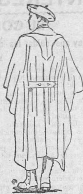
Capote confeccionado con paño de primera 57 pesetas