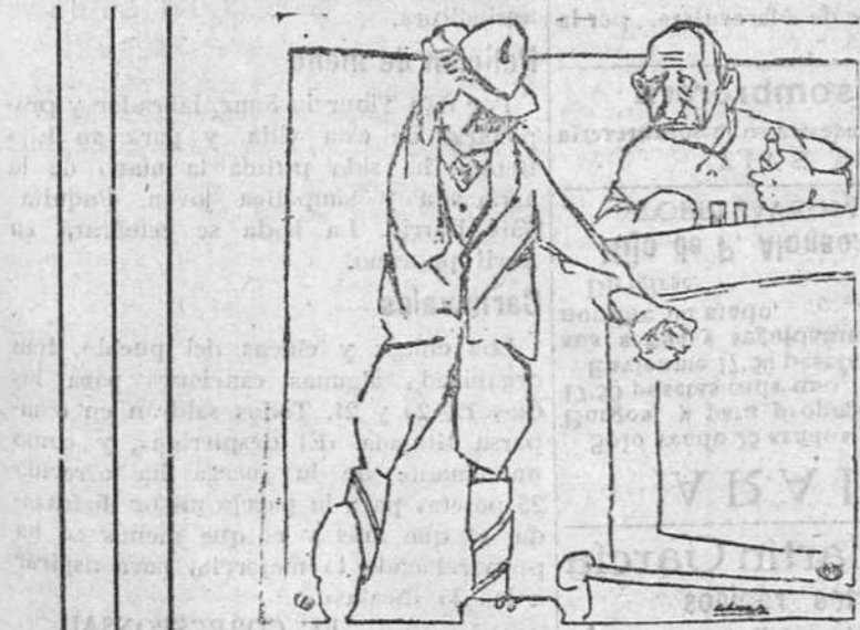
—Le digo a usted que todo el mundo, en este pueblo, agacha la cabeza ante mí. —Es usted el Cid Campeador? —No, señor. Soy el peluquero.

Nuestro estimado amigo don Luis García Lozano, presidente del Circolo de la Unión, ha tenido la atención, que agradecemos, de invitarnos a los bailes que dicha Sociedad celebrará con ocasión de las próximas fiestas de Carnaval, los cuales tendrán lugar los días 19, 21 y 26 del actual, a las diez y media de la noche.